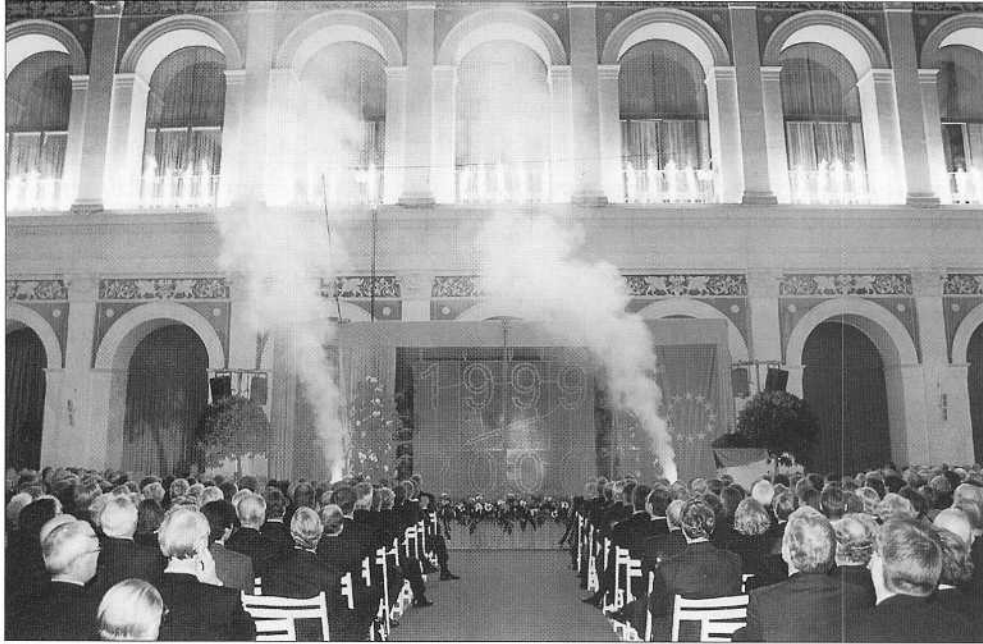
Feuriger Auftakt zum neuen Jahrtausend am 31.12.1999: Ausklang der Jahresschlussversammlung des Ehrbaren Kaufmanns (VEEK) in der Handelskammer Hamburg.