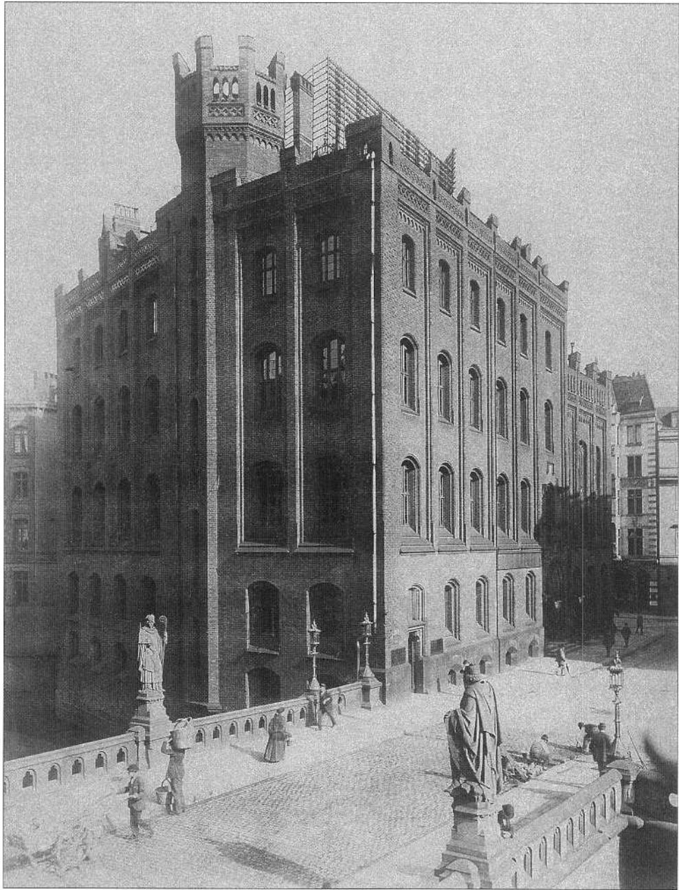
Trostbrücke mit Blick auf das Patriotische Gebäude, dem Sitz von PRO HONORE von März 1936 bis zur Ausbombung im Jahre 1943 (Aufnahme: um 1925)